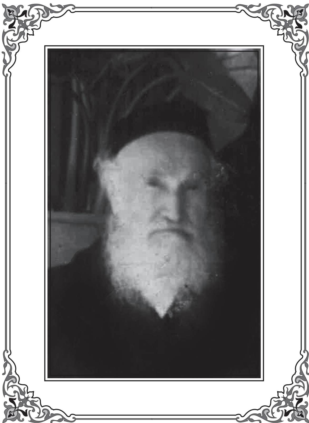
תמונת רבינו המחבר זצ"ל